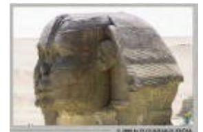
El Rostro de la Esfinge visto desde el Noreste

En Honor a la Verdad, desearía puntualizar algunos detalles muy capitales en torno a la presunta elevada antigüedad que algunos atribuyen a la Esfinge basándose en la erosión general que presenta el monumento. Se ha llegado a afirmar que debido al gran desgaste o erosión que presenta la Esfinge esta debió haber sido construida o esculpida hace alrededor de unos 10.000 o 12.000 Años antes del Presente (A.P.) en vez de los 4.500 A.P que estima la egiptología académica.